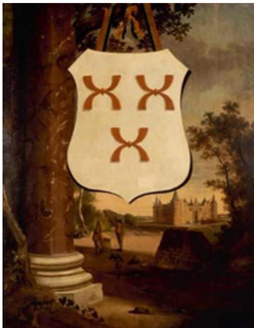
afb 5. Het district Peelland

Behalve de wapenschilden tonen ze landschappelijke en anekdotische details van de verschillende Brabantse gewesten. Zo zien we op het wapenschild van Peelland, behalve het kasteel van Helmond, turfstekers aan het werk. (afb 5). In de Statenzaal van het Gouvernement hangt de wapenschildering van de stad 's-Hertogenbosch. (afb. 6) Voor het Bossche slagersgilde schilderde hij samen met Nicolaas Frederik Knip in 1789 een vijf meter breed doek van de patroonheilige, Sint-Nicolaas. Dit schilderij hangt tegenwoordig in het stadhuis van 's-Hertogenbosch. Van Amelsfoort heeft ook een altaarstuk De aanbidding der wijzen naar Rubens gemaakt voor de St. Trudokerk in Zundert.