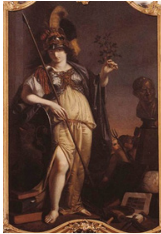
afb 4. Minerva

Behalve de wapenschilden tonen ze landschappelijke en anekdotische details van de verschillende Brabantse gewesten. Zo zien we op het wapenschild van Peelland, behalve het kasteel van Helmond, turfstekers aan het werk. (afb 5). In de Statenzaal van het Gouvernement hangt de wapenschildering van de stad 's-Hertogenbosch. (afb. 6) Voor het Bossche slagersgilde schilderde hij samen met Nicolaas Frederik Knip in 1789 een vijf meter breed doek van de patroonheilige, Sint-Nicolaas. Dit schilderij hangt tegenwoordig in het stadhuis van 's-Hertogenbosch. Van Amelsfoort heeft ook een altaarstuk De aanbidding der wijzen naar Rubens gemaakt voor de St. Trudokerk in Zundert.