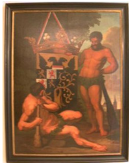
Afb 6. De stad 's-Hertogenbosch

Bosschenaar Quirinus van Amelsfoort heeft een rijke oeuvre achtergelaten. Hij was niet alleen een goede schilder maar ook actief en zeer productief in verschillende genres, zoals het schilderen van portretten, historische en zinnebeeldige onderwerpen.