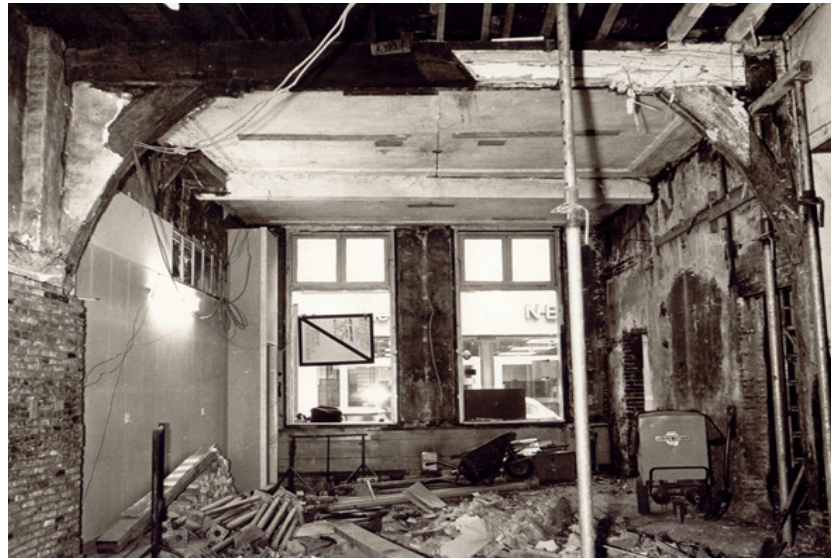
De begane grond in 1971, gezien naar de Verwersstraat, met in het midden het houtskelet.

Soms wordt gevraagd of de bouwhistorici na bijna 40 jaar onderzoek nog niet elk pand in de stad hebben gezien. Het antwoord daarop is gelukkig ontkennend. Maar hoeveel panden er dan wel zijn bezocht, is evenmin bekend. Als een pand al eens is bezocht, kan het goed zijn dat er nog schatten verborgen zijn gebleven. Dit bleek eind januari, toen begonnen werd met de verbouwing van Verwersstraat 9. Het huis dat vroeger 'De Blauwe Handt' heette en tot voor kort kantoorboekhandel Mettrop huisveste, was in 1977 door Ad van Drunen al eens bezocht. Anders dan toen, was het huis nu geheel ontmanteld en konden de beperkte gegevens uit die tijd worden aangevuld tot een verhaal dat de bouwgeschiedenis in grote lijnen dekt.