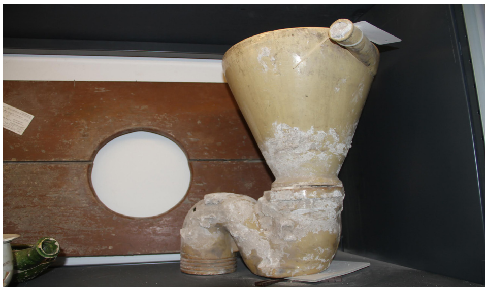
Hoppertoilet afkomstig uit het pand Hinthamerstraat 88, met bijbehorende zitting.

Het tentoongestelde Hopperexemplaar is afkomstig uit het pand Hinthamerstraat 88, de bijbehorende zitting staat erachter in de vitrinekast. Hoewel de pot wel een aansluiting heeft voor water uit een spoelinstallatie, is deze nooit gebruikt. Goed te zien is, dat deze aansluiting is dichtgemaakt. Vermoedelijk hadden veel mensen met een Hopper nog geen stromend water, óf de inhoud van de pot was moeilijk weg te spoelen, waardoor ze toch nog met een emmer water moesten doorspoelen. Dit exemplaar is gebruikt tot in de jaren zestig van de vorige eeuw.