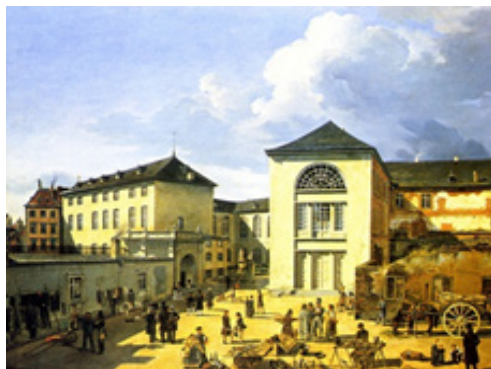
afb 2. Düsseldorfe school

academische werkwijze (afb 3). Na zijn opleiding keerde hij terug naar zijn geboortestad waar hij de rest van zijn leven is blijven werken en waar hij een goed lopende kunsthandel had.