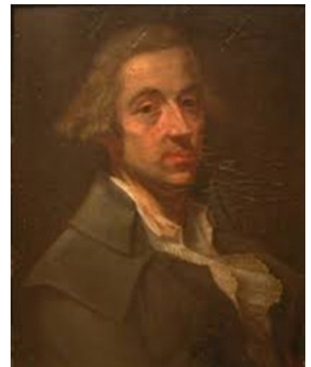
afb 1. Zelfportret

Over Quirinus van Amelsfoort (afb 1) is tot op heden niet echt veel geschreven. Terwijl hij in zijn tijd toch een zeer populaire kunstenaar was. Van Amelsfoort werd omstreeks 1760 geboren in 's-Hertogenbosch en overleed aldaar in 1820. Zijn vader, Godefridus van Amelsfoort, was ook kunstschilder en leermeester van zijn zoon Quirinus. Het werk van Quirinus vertoont veel kenmerken van de Barok. Deze feestelijke en uitbundige stijlperiode (1600-1750) versmolt beeldende kunst en architectuur met elkaar tot een geheel. Quirinus bezocht de academie in Dusseldorf. Deze academie beschikte over een schilderijengalerij met 17de eeuwse Italiaanse en Hollandse schilderijen die gekopieerd mochten worden. Het werk van de Dusseldorfse school (afb 2) wordt gekenmerkt door fijn gedetailleerde, fantasievolle landschappen, vaak gesitueerd in religieuze of allegorische verhalen. De invloed van deze voorbeelden is herkenbaar in zijn