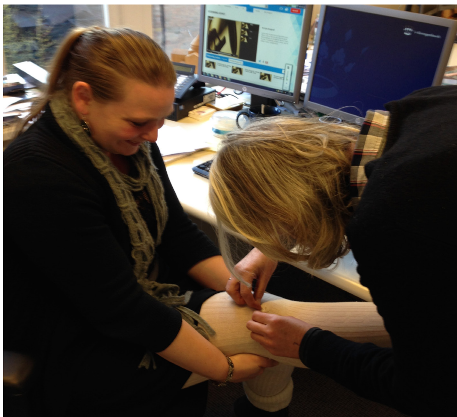
Een indringend overleg tussen hoofd depot en hoofd lab

Omdat we geen kopij hebben voor deze rubriek volstaan we met een foto.