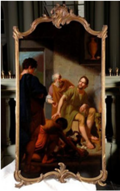
afb 3. Curius Dentatus weigert de geschenken van de Samnieten